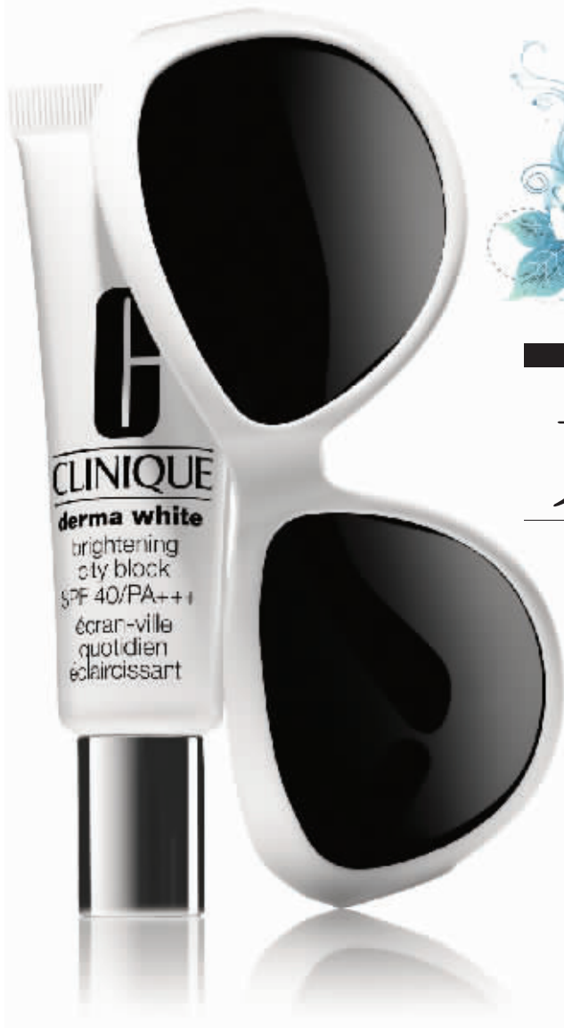
Clinique 倩碧晶采嫩白防晒隔离霜 SPF30+/PA+++ 30ml/395元