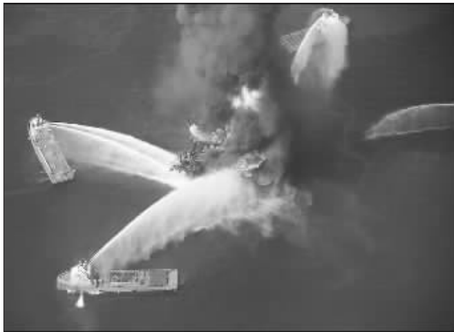
爆炸钻井平台浓烟滚滚,救火船正在现场灭火