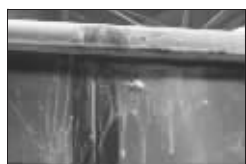
新疆球迷赛后用鸡蛋攻击广东队大巴

CBA总决赛第四战昨天进行,赛前篮协已把总冠军鼎运到了现场,但手握赛点的广东队并不想这么快就结束,昨天他们在客场以94:97负于新疆队。而昨天某门户网站在赛前就指出,广东队故意在客场输球,以期在主场完成加冕六冠王的仪式。