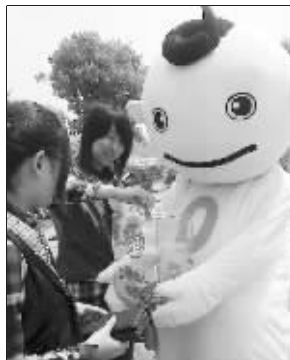
“零帕公仔”在募集善款

后,第一时间对活动内容进行调整,并迅速联系爱德基金会,联合在活动现场增设“零帕一族,情牵玉树”的“零帕”爱心义卖活动,义卖所得将全数捐给爱德基金会,用于与青海地震相关的慈善救助。