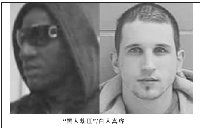
“黑人劫匪”/白人真容

经过对银行闭路电视监控录像的反复观摩,警方初步认定,案犯是一名黑人,秃顶,胡子刮得很干净。警方随即公布了热线电话,