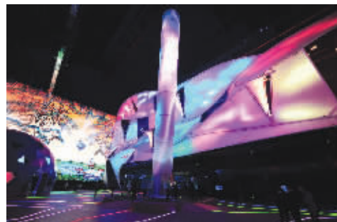
绚烂的灯光为我们勾勒出一个城市的未来