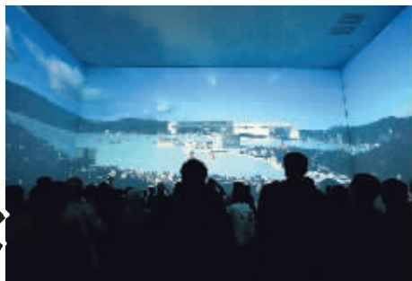
在冰岛馆内,你可以看到一场立体短片