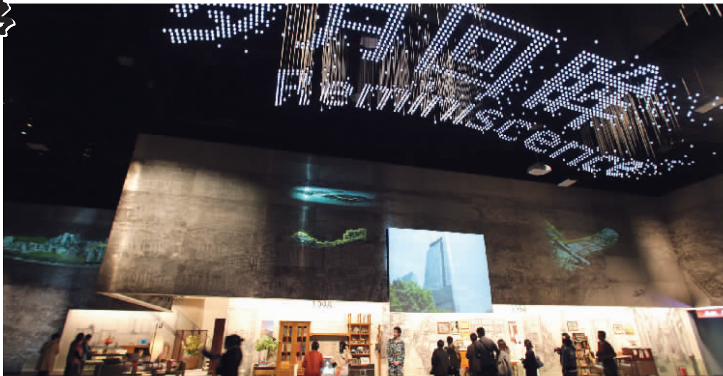
中国国家馆内的岁月回眸展厅

世博会,那么多各具特色的场馆,那么多场精彩纷呈的演出,那么丰富的各国小吃,在有限的时间内,到底应该怎么玩?这实在有些“老虎吃刺猬——无从下口”。