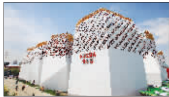
“童话城堡”俄罗斯馆