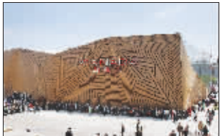
“木制几何”加拿大馆