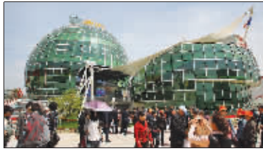
“咬一口苹果”罗马尼亚馆