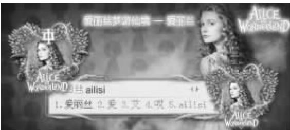
各种可爱的输入法皮肤