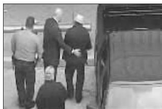
戴白帽子的就是被引渡的诺列加