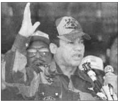
被美国逮捕前的诺列加 (资料照片)