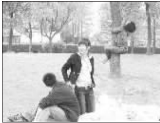
“后面爬树的人太讨厌啦”

网友拍出的照片,经常会出现这样的问题,就是照片上出现了不该出现的其他人。不少“聪明”的网友知道这不是个难题,只要发到网上,让懂PS技术的网友PS掉就可以了。然后,这样的照片就成了难得的PS素材,PS狂