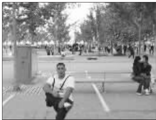
“楼主,没凳子还这么淡定?”

杯具第一季,网友非但没完成任务将后面的人PS掉,还给主角手中硬塞了个道具,上面画着禁止亲热的标识。杯具第二季,网友见白衣哥们很壮,便把半张凳子PS下来,塞到他手里,看上去就像他折断了一样,但是后面