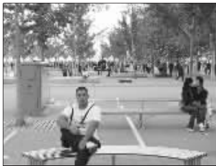
“帮我把亲热的情侣PS掉!”

与爬树女人同样的杯具,还有一位强壮帅气的白衣男。照片拍摄于一个广场,这哥们坐在一个长凳上,而后面的一个长凳上,一对男女正坐着卿卿我我。白衣哥们把照片发到网上说:“求PS牛人,帮我把后面的两个人PS掉!”