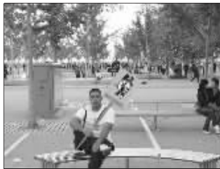
“举牌禁止亲热情侣出没!”

与爬树女人同样的杯具,还有一位强壮帅气的白衣男。照片拍摄于一个广场,这哥们坐在一个长凳上,而后面的一个长凳上,一对男女正坐着卿卿我我。白衣哥们把照片发到网上说:“求PS牛人,帮我把后面的两个人PS掉!”