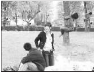
“或者让她重复出现……”

欢开始了。近日,一位网友将其跟女友在草坪上的照片贴出来,说:“麻烦PS高手把我后面爬树的女人PS掉。”原来,他们背后有一棵大树,一个女人莫名其妙地爬在树上,果然影响了照片的雅观。在网友的努力下,PS的精