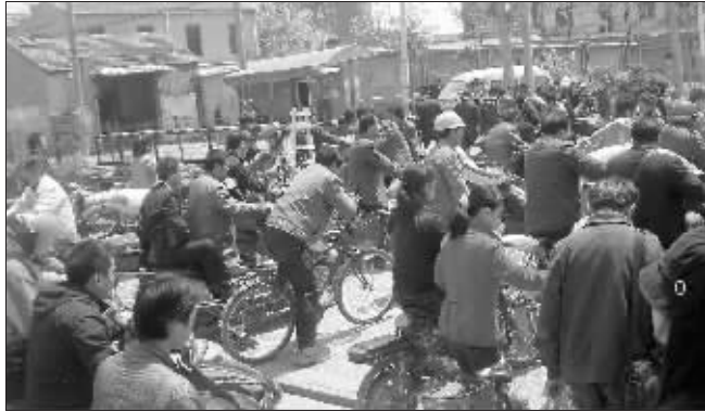
长虹路道口拥挤不堪

道口一工作人员说,早高峰时,道口人流车流量特别大,“遇到火车通过,很多人都要抢着过去,秩序很差。大家你争我抢,最后就堵了。”据了解,通常12小时内,长虹路道口要通过40列火车,平均一小时四五列。