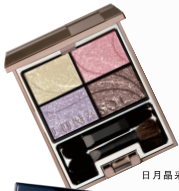
日月晶采 漾境眼影