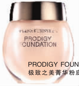
PRODIGY FOUNDATION 极致之美菁华粉底液