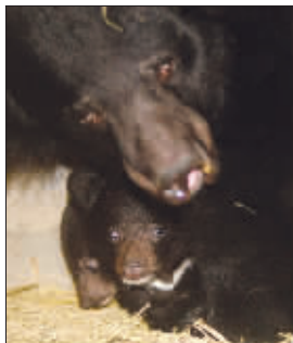
上图:“小二黑”当爹了 右图:动物们在卖力表演