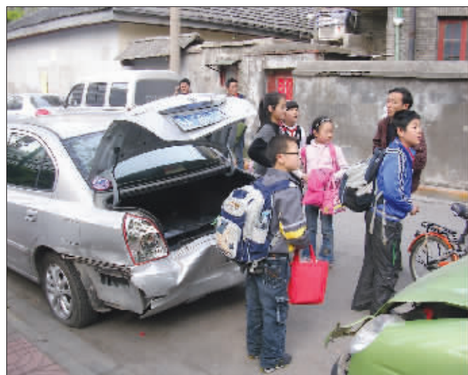
李某的车已经“皮开肉绽”了

昨天下午，白下区户部街小学刚下第二节课不久，学生们正在休息、嬉闹。突然，一名男子出现在教学楼下，拎起一个女生的衣领就往外走。冲过保安阻拦后，男子将女生塞进一辆现代伊兰特轿车，试图驾车逃离，但慌乱中连续撞上停在路边的4辆轿车。男子最终被警察当场抓获，但前来接孩子的家长们一个个惊魂不已：“幸好不是放学时候，不然会出多大事啊！”