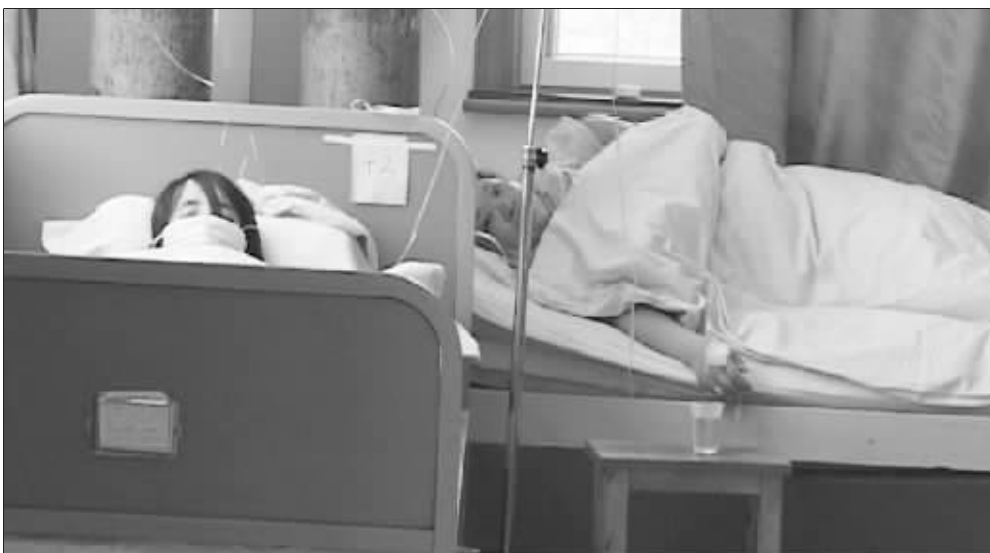
中毒的尼康员工正在挂水