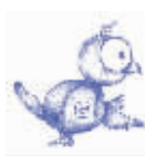
“微生物”的标志 twitter小鸟

“懒”这件事,总归会有点不好的地方:“比如有时熬夜上推,影响我第二天工作和健康。”于婆给自己上了点强制措施:“我会强制自己零点下线,会留下一条推说‘午休停推’。”这个习惯执行到了最后居然有网友主动监督:“超过午夜我若再发消息,会被网友们轰下来或者哄下来。”