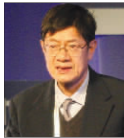
张卓元 第十届全国政协委员、中国社会科学院学部委员