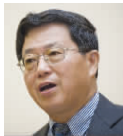
迟福林 第十一届全国政协委员、中国(海南)改革发展研究院院长