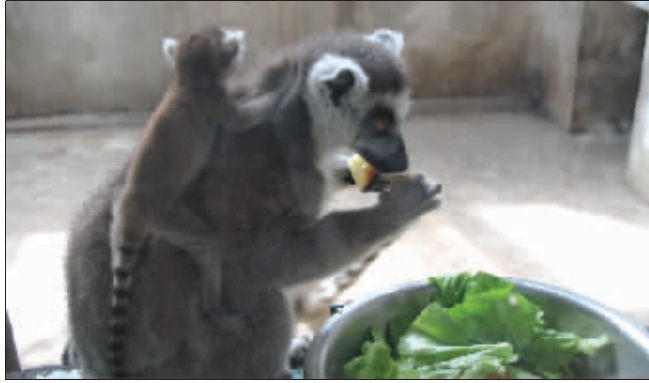
►亲密的母子俩

最近,红山动物园可真是兽丁兴旺。继白虎园喜得幼崽后,红山动物园环尾狐猴家族又传来了好消息:环尾狐猴小灰的3位妻子,相继为它产仔,其中大老婆大环一下子生了俩。环尾狐猴家族双胞胎可是相当罕见的,在红山,这还是首例。