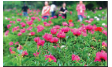
芍药满园

快报讯(记者 孙兰兰)赏罢牡丹赏芍药。花王牡丹花期已过,而它的姐妹花芍药,眼下开得正好。近日,不少摄影爱好者扛着装备,来到情侣园芍药坞拍下它们美丽的姿容。