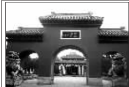
为纪念医圣张仲景而建立了南阳医圣祠。1988年,医圣祠被国务院公布为全国重点文物保护单位。