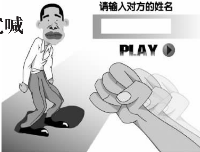
发泄游戏,输入你讨厌的人的姓名,就可以在网上“揍”他一顿

在一家名为“yayapay”的发泄网站上,网友发布的帖子被分为不同的区域,有社会篇、工作篇、情感篇、人性篇等近20个种类。点开工作篇里的内容,就有80多条内容,其中很多都是抱怨工作劳累或是老板刻薄的,但也有部分帖子的内容不堪入目:不仅脏话连篇,还指名道姓地辱骂对方,个别人甚至故意将攻击对象的具体地址、名字等隐私内容都公布在了帖子上。另一家名为“我要发泄”的网站上,除了有公共发泄帖外,还有一个叫“发泄室”的区域。在发泄室里,发泄对象可以把自己讨厌的人名字贴在一个虚拟的flash动画人物上,再选择用虚拟的手、脚或是木棒手枪等对其进行袭击,直到对方被你“折磨至死”为止。这些供人发泄的网站大多以免费的形式供人发帖宣泄情绪,还有一部分则以付费的方式进行,还有终身保留