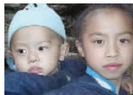
凤姐进入娱乐圈有戏了,原来她姐姐是蔡依林啊!