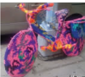
酷暑夏日,骑着毛衣单车,不怕中暑么?