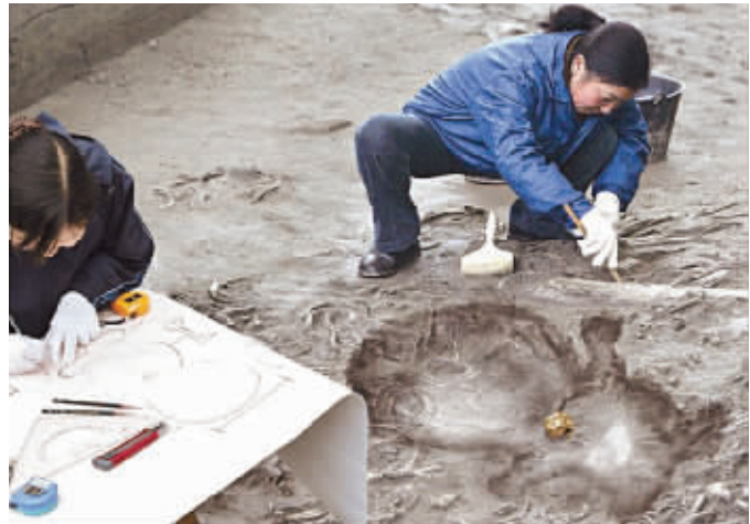
某媒体报道的哆啦A梦遗骸考古现场

近日,百度贴吧上一个题目叫《哆啦A梦原籍中国,古墓遗骸证实》的帖子迅速走红,该帖有图有真相,用照片展示了报纸上的一篇报道,报道的标题赫然写着“古墓遗骸,证叮当原籍中国”。先不论哆啦A梦是哪国人,它一个漫画人物,怎么会有“遗骸”呢?对于假得不能再假的报道,网友们表示震惊了。记者通过搜索了解到,其实这是今年愚人节时某媒体的一个恶搞。