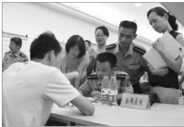
上周日,在“八一”建军节到来之际,苏州市人力资源和社会保障局、苏州市国资委等联合举办了“2010年苏州市暨73041部队随军家属就业岗位洽谈会”。28家企业端出345个就业岗位,吸引了117名随军家属前往应聘,最终有66人达成就业意向。在今年随军家属招聘会上,应聘者的年轻化和高学历是最大亮点,多数应聘者是70后,80%以上是大专学历。