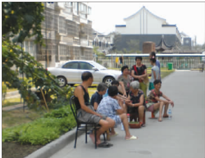
向阳苑的居民室外乘凉