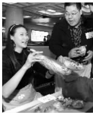
赵蕊蕊推销面包

昨天下午2点,排球名将赵蕊蕊现身地铁二号线新街口站进站口,她不是来坐地铁的,而是参与“爱在地下铁,分享共同成长”的面包义卖活动的。