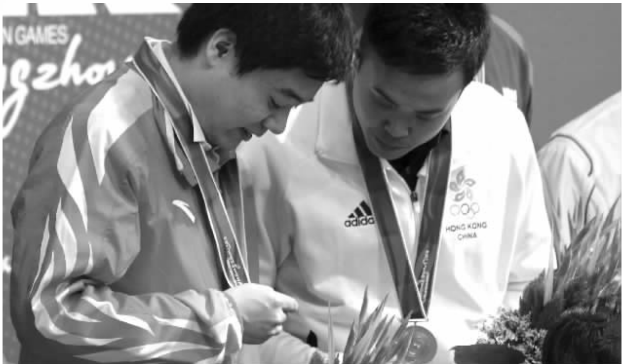
银牌看起来也不错