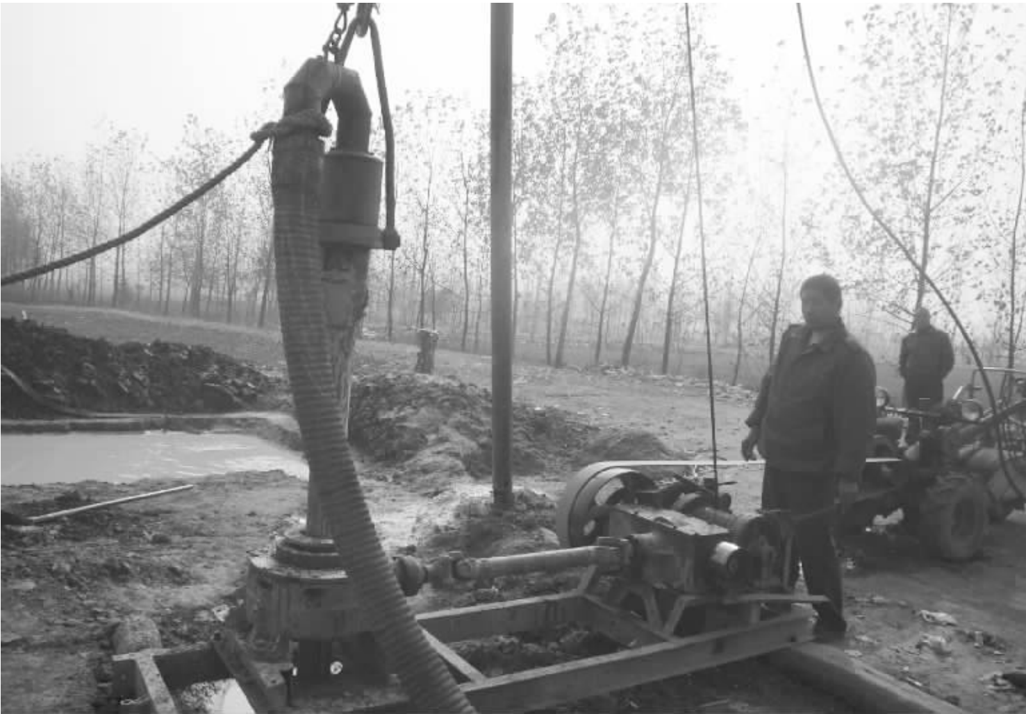
新沂市水利部门组织打井队来到棋盘镇掘井保苗