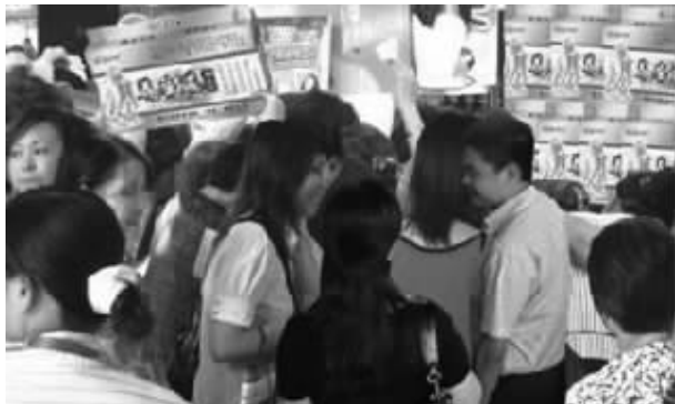
许多南京市民都争相体验【养生道·寿孔枕】

近日,我市众多老病号纷纷换用央视报道的三只眼枕头,据市民反应,不仅失眠、三高、颈椎病、耳病等病症逐渐好转,时值入冬还能增强免疫力,不得感冒。据专业人士透露,此枕集合了中医经络学的3大疗法,还和2500年前老子的“孔枕”如出一辙,长期枕用还有延年益寿之效。它真那么神吗?