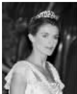
西班牙王妃 莱蒂齐亚

与热心社会工作的文雅丽相比,约阿希姆王子更多地出现在球场、赛车场上,被称为“派对王子”。文雅丽与约阿希姆王子于2005年离婚,这也是丹麦王室1846年以来的首例离婚。