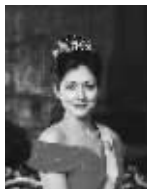
前丹麦王妃 文雅丽