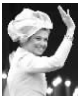
荷兰王妃 马克西玛

莱蒂齐亚·奥尔蒂斯的出现,让西班牙王室的受关注度明显提升。用王室观察家的话说:“奥尔蒂斯热”刮进了西班牙王室,让王室也因此沾光,受到前所未有的瞩目。”