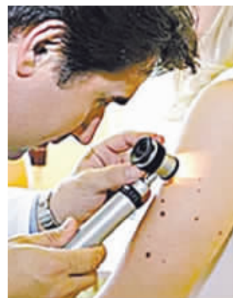
一万个痣里面大约只有一个是恶性的

痣一般长在哪里最危险？许惠娟告诉记者，一般光滑的，没有体毛的地方，如果长了痣，那就要注意了。其中，一定要重点关注的就是手掌、脚掌、生殖器附近的痣，因频繁摩擦，这些部位的痣会发生病变。特别是足底的黑斑，不痛不痒、无伤大雅，其实是最危险的“恐怖分子”；其次，头部、颈部，因长期阳光暴晒，