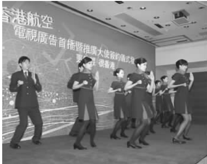
空姐经过训练,才能对付“不守规矩”的乘客

记者昨天致电香港航空公司总公司及公关部,对方称让记者参阅公司官网上的相关信息,不再对此做进一步声明。