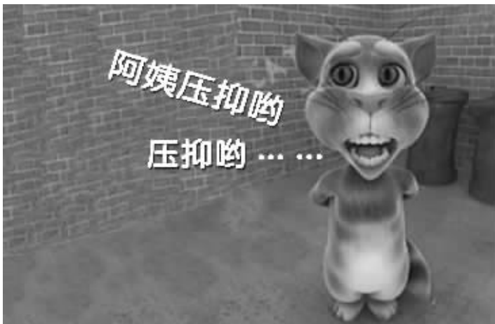
汤姆猫唱到副歌部分声嘶力竭

乞讨理由五花八门,有的说自己儿子得了白血病,没钱治病迫不得已;有的则打出慈善牌,声称是