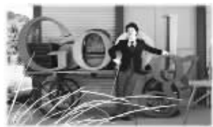
4月15日纪念卓别林122周年诞辰