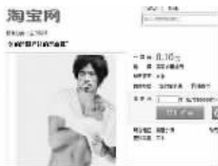
有的网店用犀利哥的形象行乞(截图)

淘宝上南京本地的一个店主,在自家网店中加了一个乞讨链接,一个全名为“为了爱情网络乞讨,情人节、清明节给爱情上香”的商品,定价是1分钱,30天内已经售出了12件,是南京本地“网络乞讨”商品里的销量冠军(4月11日本报全媒体版曾做报道)