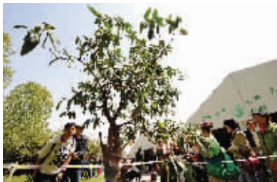
千年高山杜鹃

最吸引人的,是一株名为“气壮山河”的高山杜鹃。它获得了本届花展的“优秀驯化奖”,28万元的挂牌价让很多游客咋舌不已。“兰花成千上万的不稀奇,杜鹃花还没见过这么贵的。”几名老人议论着。来自石家庄的参赛者告诉记者,这是从江西移植来的古桩。别看这株杜鹃只比人的胳膊粗一点,其实已经有“千岁”了,“斧头都砍不动它。”高山杜鹃一般生长在海拔2000米以上的地区,而眼前这株原来住在海拔4000米的地