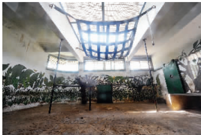
乐申的新房等你来布置