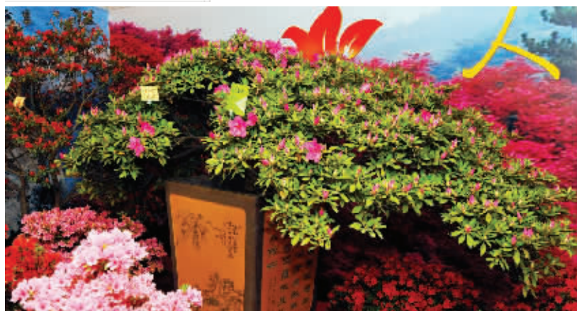
“大金凤”夺得造型“花魁”

为期18天的第九届中国杜鹃花展,昨日在南京玄武湖景区拉开帷幕。樱洲上有9处室外景点,来自全国9个城市通过各地微缩景观搭配当地的特色杜鹃,展现出各自的城市特色。要想看精品呢,可以去翠洲上占地2000平方米的室内展区,这里共有40个展台,本届花展的获奖精品都在这里展示。