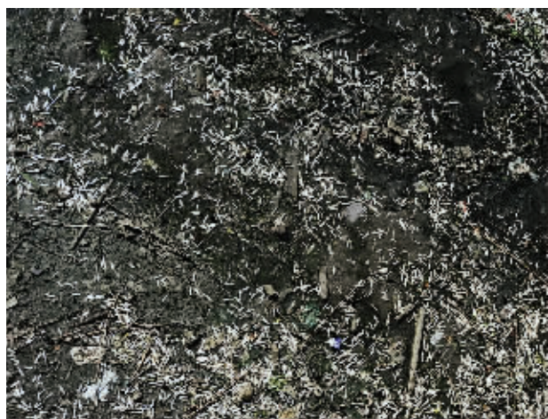
集庆门段死鱼最多