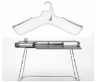
两位设计师的代表作(上: 衣架 下: 简易书桌)

此外, 他们还涉及室内设计领域, 其中有达明安·赫斯特(国际公认应该最具影响力艺术家)在诺丁顿山的Pharmacy餐厅, 史黛拉·麦卡特尼(国际时装设计师)在纽约的新店。两人最引以为豪的作品是为普次茅斯的圣托马斯教堂设计的极简主义木椅, 成为当地的一大旅游景观。