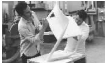
火炬设计者就是他们

本次伦敦奥运火炬的设计者, 是英国著名的设计师爱德华·巴贝尔和杰伊·奥斯格比。他们把这支火炬取名“光辉的瞬间”, 两人是世界闻名的室内设计师, 于1996年合办了“巴贝尔&奥斯格比”设计工作室, 出自他们手中的作品, 简约而不简单。2000年为国际知名品牌Levi's(李维斯)设计了一种在9000个店面同时使用的衣架, 设计清新大方, 却极好突出了粗斜纹布料制成的新系列服装的空间感, 是艺术感和实用性的完美结合。现在, 流行品牌