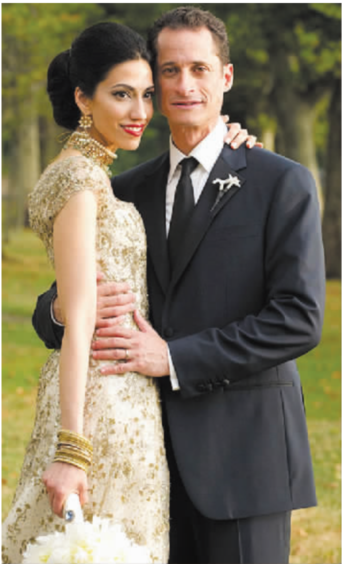
安东尼·韦纳与妻子胡玛·阿贝丁

据英国媒体6月7日报道,性丑闻缠身的美国纽约众议院民主党议员安东尼·韦纳,日前再次被曝曾使用国会公用电话进行色情聊天。这名即将竞选纽约市长的民主党人6日召开记者会,承认至少与6名女子在微博上交换不雅照。