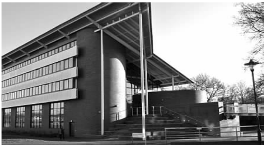
英国华威大学研究中心是秘密进行人兽杂交的实验室之一