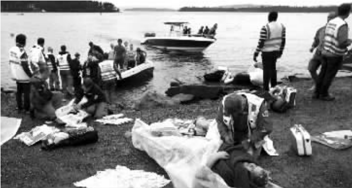
一天后,噩梦般的屠杀降临