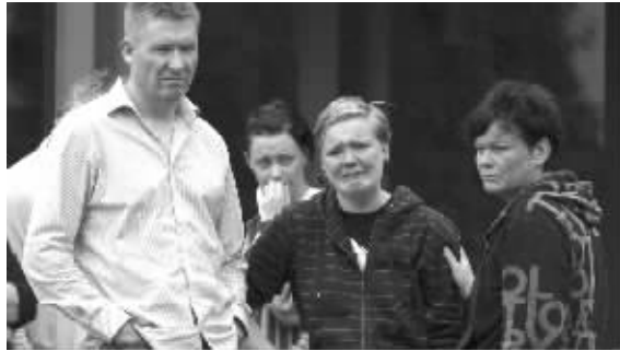
奥斯陆市中心大爆炸,7人死亡 枪手在于特岛大屠杀,85人死亡