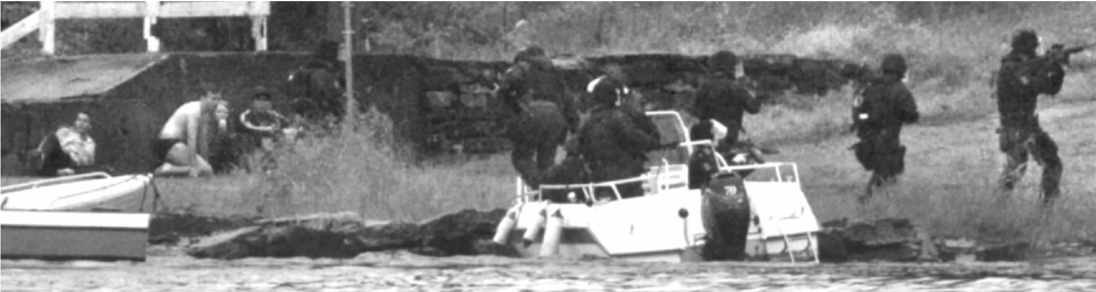
挪威特警登岛,与枪手交火。很多人躲在隐蔽处逃避枪手追杀