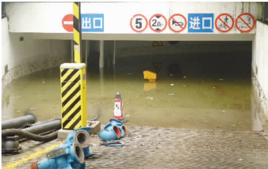
7月19日，大型抽水机正在被淹的银城东苑地下车库入口抽水