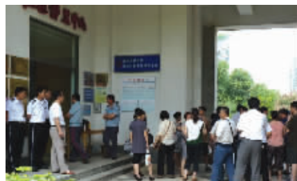
昨天，业主聚集在物业门口