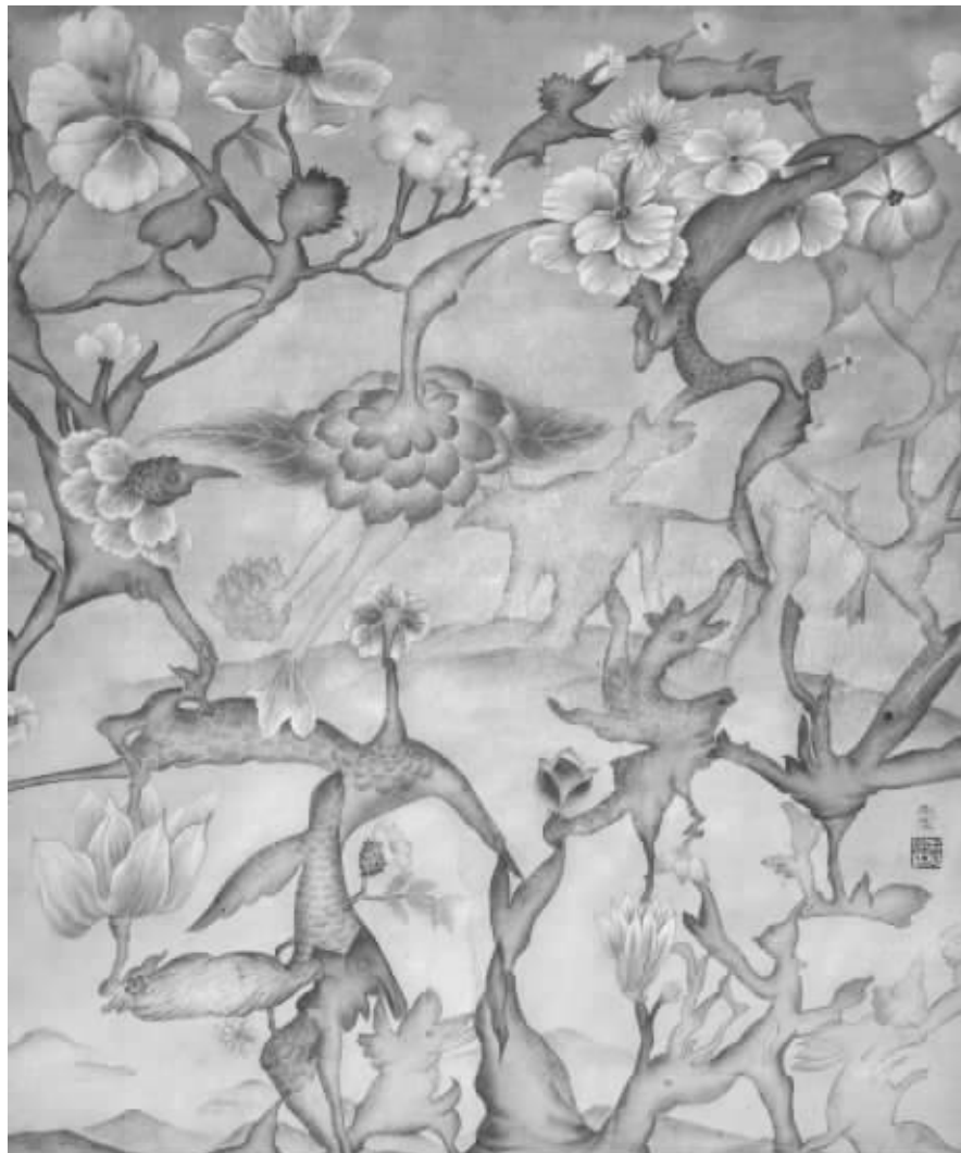
参展作品 生命的界分与链接 No.11 设色纸本

1958年生,江苏宜兴人。江苏省美术家协会会员,江苏省花鸟画研究会会员,毕业于南京艺术学院,现受聘于南京书画院。作品发表于《美术》、《江苏画刊》、《美术观察》、《中国画研究》等多本刊物,曾参加日本、美国及北京、南京等国内外展览,在南京、北京、台北、宜兴等地举办个人画展。