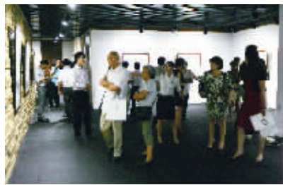
预展现场嘉宾热情高涨