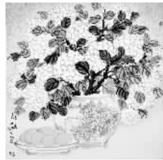
参展作品 春之秀 设色纸本