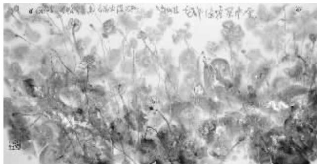
参展作品 云中闲看满池花 设色纸本

聂危谷说自己半生境遇不顺。文革中，“走资派”父母遭受人格污辱，童年识尽愁滋味；少年时患慢性病多年，全身心体验了“幽禁”的恐慌；后来读卡夫卡的《变形记》，惊叹其笔下人物逼真地再现了他的儿时心态。70年代成为改革高考制度后的首届大学生，时来运转，但因为过早接受现代艺术反美学观念的影响，毕业创作“丑化劳动人民”，被剥夺了参加毕业展览的权利；90年代，又因为创作了《凡高》系列，被一位曾占据省美协要职的尊长剥夺了入会资格。