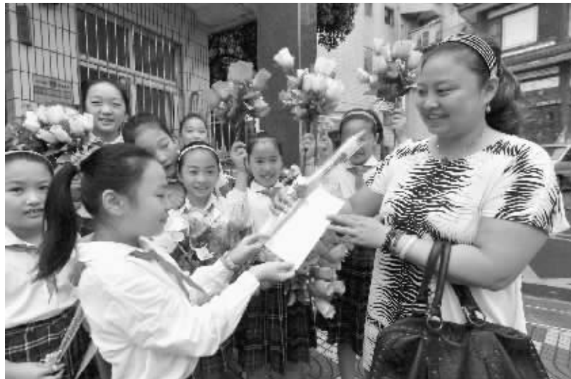
昨天,洪武北路小学的少先队员排队在门口迎接老师,当老师走进校门时,学生们齐声喊“教师节快乐!”学生代表向老师送上一张贺卡和一支鲜花,祝老师们节日快乐。今天是教师节,祝老师们节日快乐!