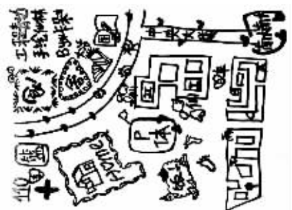
胡淑雅版手绘地图 图片均由制作者提供