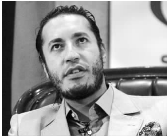
萨阿迪2005年2月7日在澳大利亚悉尼的资料照片

12日,中方宣布承认利比亚“全国过渡委员会”为利比亚执政当局和利比亚人民的代表。