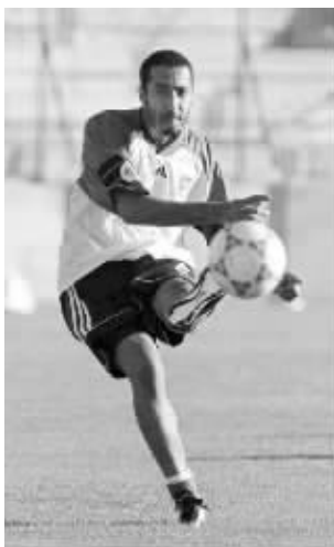
萨阿迪曾经是职业足球运动员