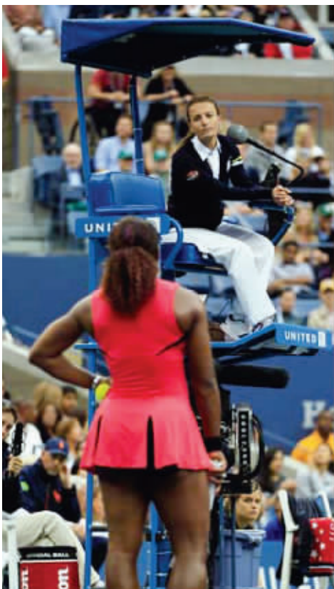
小威和裁判较上劲了

昨夜,美网女单决赛大爆冷门,夺冠热门、美国悍将小威廉姆斯连输两盘(2:6、3:6),不敌澳大利亚重炮斯托瑟。斯托瑟夺得了个人职业生涯第一个大满贯,也是澳大利亚31年来第一个女单大满贯桂冠。