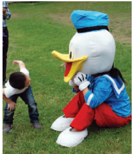
唐老鸭,你累了吗,再陪我玩会嘛!9月11日摄于莫愁湖公园。 (作者冯晓获30元话费)