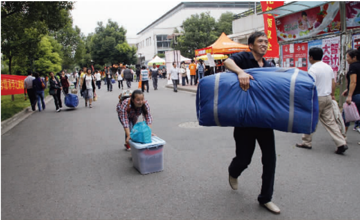
最重的包裹,永远是爸爸扛着。又是一年大学新生入学日,校园里总会见到这样的景象。9月10日摄于江苏教育学院浦口校区。 (作者陆大伟获30元话费)