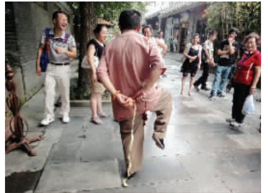
单脚站立,在背后削苹果还不断皮,你行不?9月10日成都游玩时拍摄。 (作者柏法萍获30元话费)