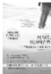
《因为痛,所以叫青春》 作者:金兰都 广西科学技术出版社 定价:29.80元