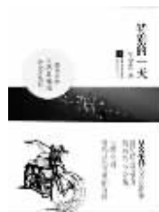
《特别的一天》 作者:吴念真 江苏文艺出版社 定价:28.00元