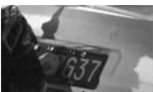
▲英菲尼迪车子牌照还用光碟做了遮挡

翻滚的距离长达70米。整个事故的过程,不到10秒钟。等交警赶到现场时,从车内抛出的两人以及被撞的行人均已死亡。英菲尼迪轿车内还卡着的司机后来虽然被救出,但早已没有了呼吸。