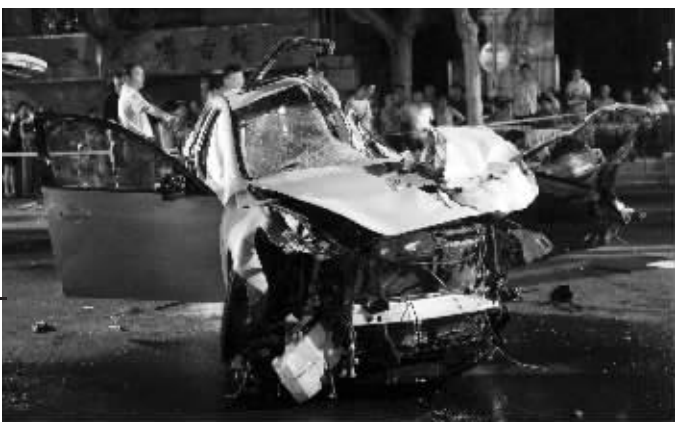
▲消防人员破拆英菲尼迪救出被卡的司机,发现其已经死亡