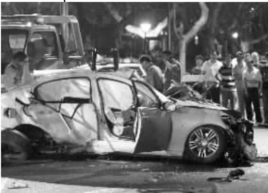
▲就是这辆白色英菲尼迪醉驾闯红灯 ◀正常行驶的蓝色货车被闯红灯的英菲尼迪撞掉了两对后车轮及轮毂