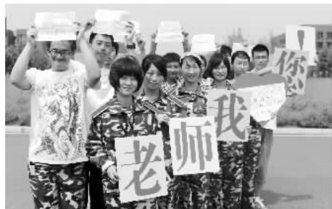
感谢师恩

快报讯(记者 黄艳)昨天,南京29中原高三年级的老师们收获了一份特别的感动。教师节前,17位今年考入南京大学的29中高三毕业生,写下感谢信感谢师恩。他们还在南京大学仙林校区门口,举着“老师我爱您!”的牌子留影。