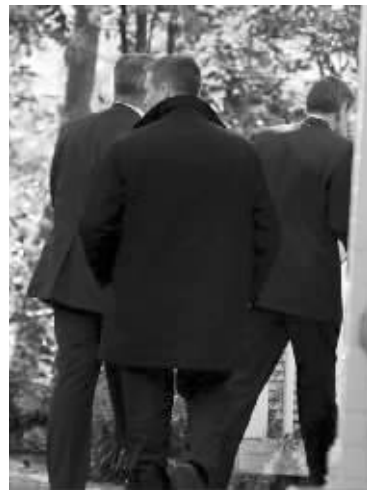
听证会结束后,彼得雷乌斯(右)迅速走出国会大厦

下通道,通过这个地下通道进入了国会会场内,之后被安排到了作证的现场。事后有媒体感慨:他真不愧是中情局的头子!