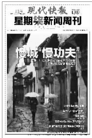
(11月4日星期柒新闻周刊封面)

首份防治社会领域腐败的顶层设计文件出台,是个好开端。而怎样着力防治权力领域的腐败,应该更重要。所以说顶层设计,只是迈出了全面防腐反腐第一步。