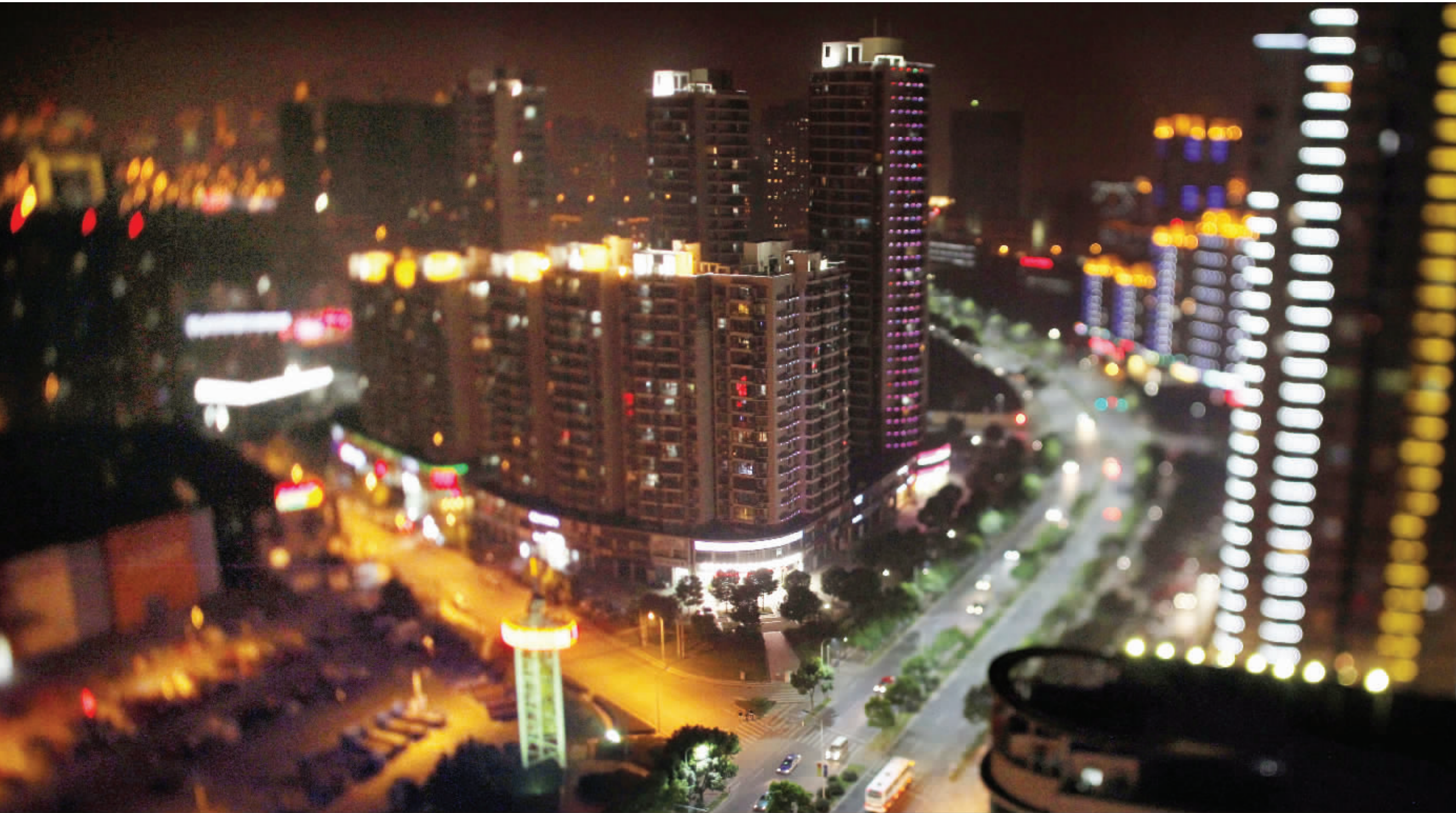
无锡高新区绚烂的夜景，让人恍如置身梦境