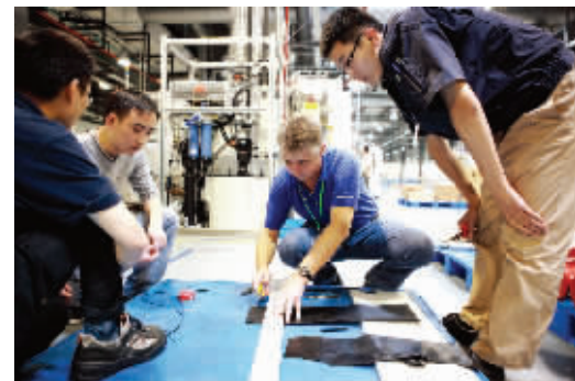
外籍员工进行示范指导