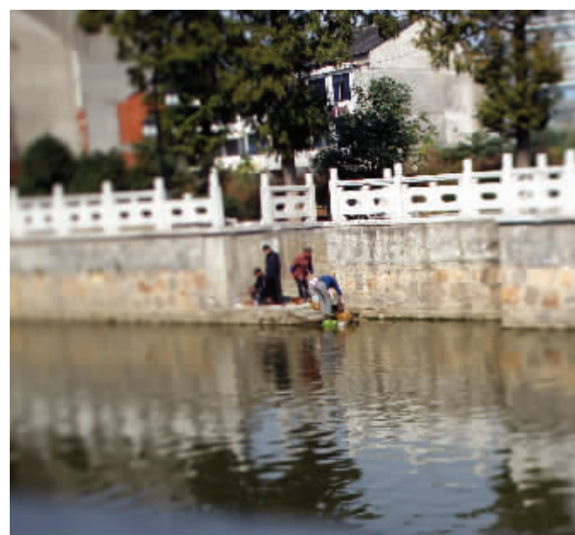
正在河边淘米、洗菜、垂钓的市民