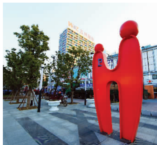
街边的雕塑，散发着抽象艺术的气息