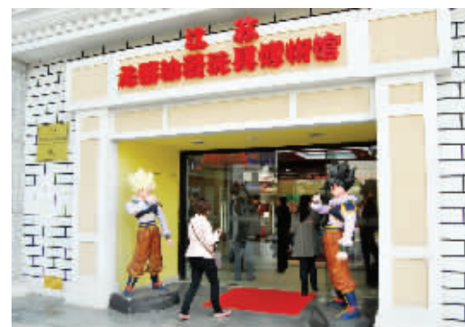
长三角地区最大的动漫陈列体验博物馆