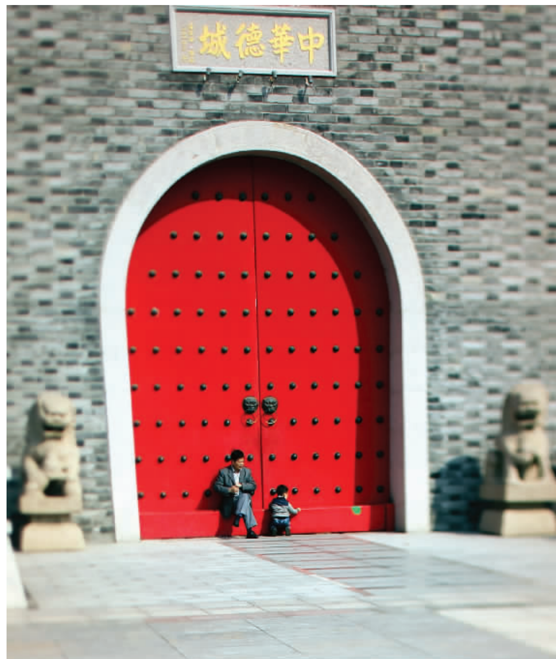
新区其实不新，还相当古老，这里是吴文化的发祥地。图为梅村中华德城广场