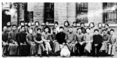
上世纪30年代教职工合影

学校为了照顾学生入学要求,尽量多收学生,为解决校舍需求,还设有流动班级,利用上音乐、体育课的空教室上课。