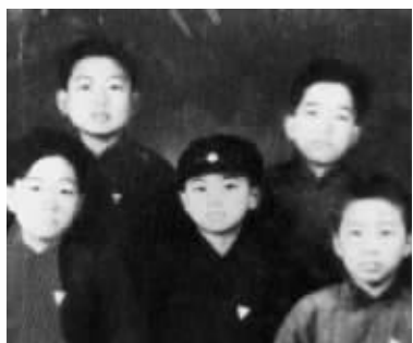
上世纪40年代地下党小交通员