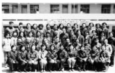
上世纪70年代教职工和地下交通员合影