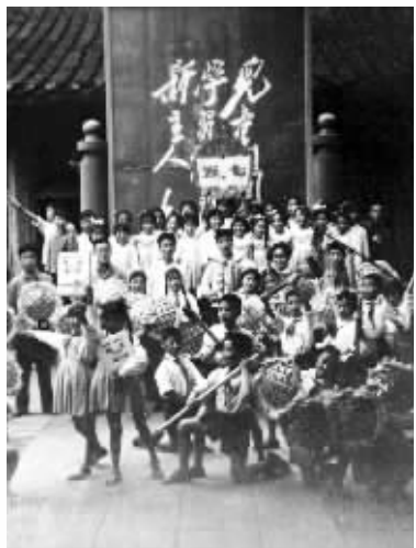
孩子们的文艺表演